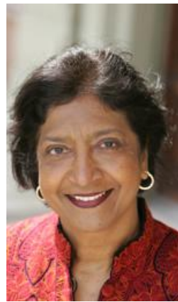
(asina husi) Navi Pillay Nasoins Unidas nia Alta Komisária ba Direitus Umanus