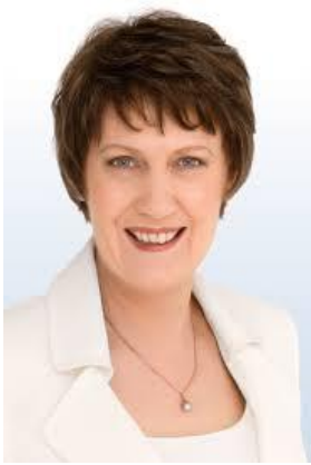
(asina husi) Helen Clark Prezidente, Nasoins Unidas nia Grupu Dezenvolvimentu

Lihosi publikasaun ida-ne'e, UNDG iha objetivu atu hatudu benefísiu ne'ebé bele hetan bainhira integra direitos umanus no oinsá ONU nia ekipa nasional sira no Koordinador Rezidente sira masimiza direitos umanus nia autoridade normativa iha sira-nia serbisu dezvoltimentu hodi fó benefísiu ba ema iha mundu tomak. Ho maneira refere, ami hein katak bele enkoraja no fó inspirasaun ba kolega sira iha terrenu hodi kontinua sira-nia esforsu atu lori ba oin iniciativa sira atu integra direitos umanus.