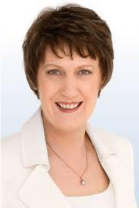
(asina husi) Helen Clark Prezidente, Nasoins Unidas nia Grupu Dezenvolvimentu

Lihosi publikasaun ida-ne'e, UNDG iha objetivu atu hatudu benefísiu ne'ebé bele hetan bainhira integra direitos umanus no oinsá ONU nia ekipa nasional sira no Koordinador Rezidente sira masimiza direitos umanus nia autoridade normativa iha sira-nia serbisu dezvoltimentu hodi fó benefísiu ba ema iha mundu tomak. Ho maneira refere, ami hein katak bele enkoraja no fó inspirasaun ba kolega sira iha terrenu hodi kontinua sira-nia esforsu atu lori ba oin iniciativa sira atu integra direitos umanus.